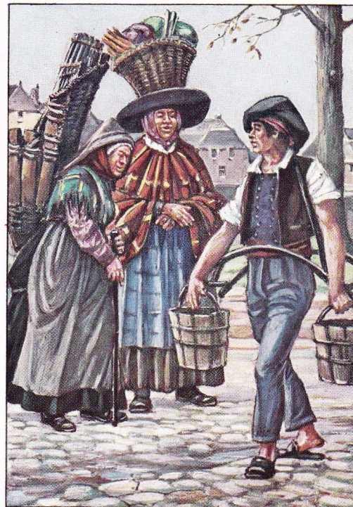
KLEINE STRAATAMBACHTEN VAN VORHEEN. 6.