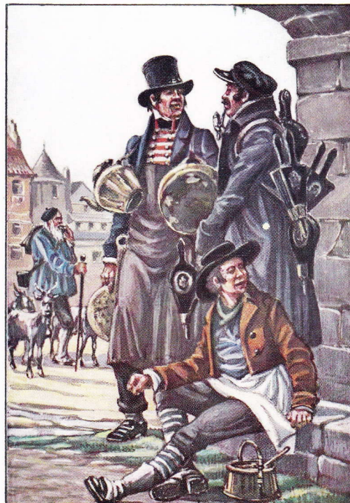
KLEINE STRAATAMBACHTEN VAN VORHEEN. 5.