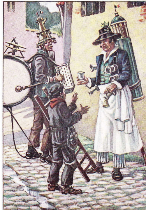
KLEINE STRAATAMBACHTEN VAN VORHEEN. 3.